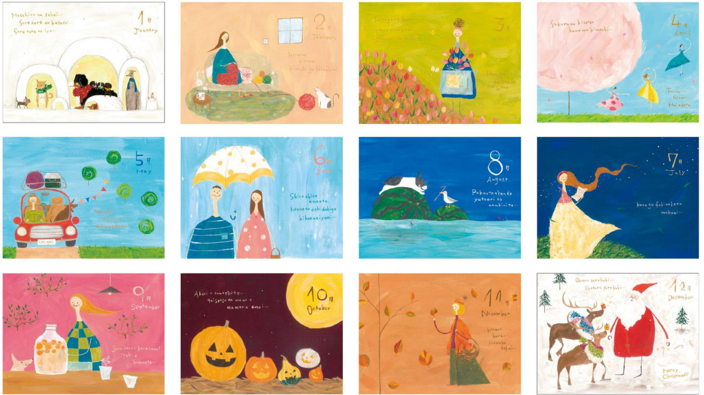
● 2019年のイラストはただいま制作中(テーマ:「暮らし」)